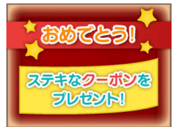
ナムコのお店でDS クイズ画面