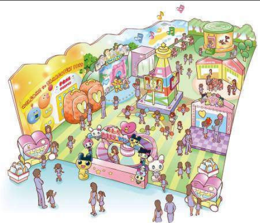
施設全体のイメージ図