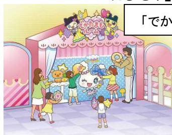
「でかたまもルーム」

※人気玩具「たまもルーム」をお子様の等身大サイズで再現した「でかたまもルーム」で遊ぶことができます。