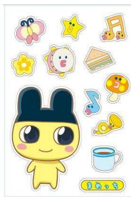
「でかたまもりしーる」