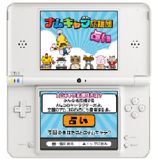
「ナムキャラ応援団占い」画面イメージ