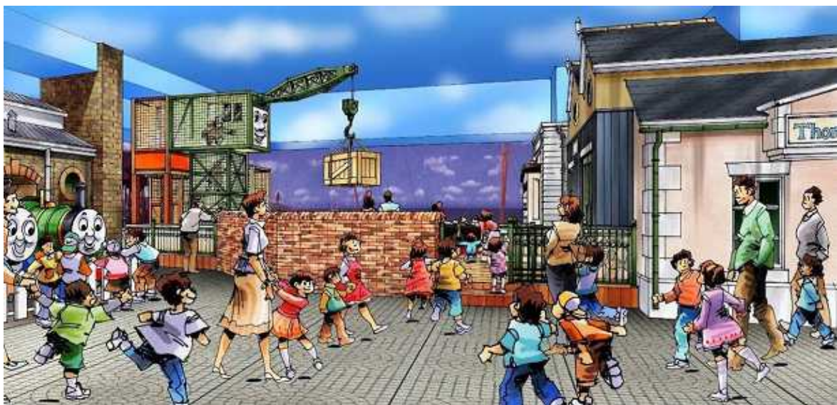
「ブレンダム・ドック」(アトラクションエリア)