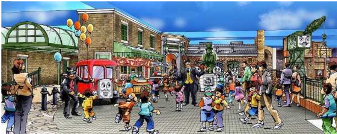
「ナップフォード スクエア」(駅前広場)