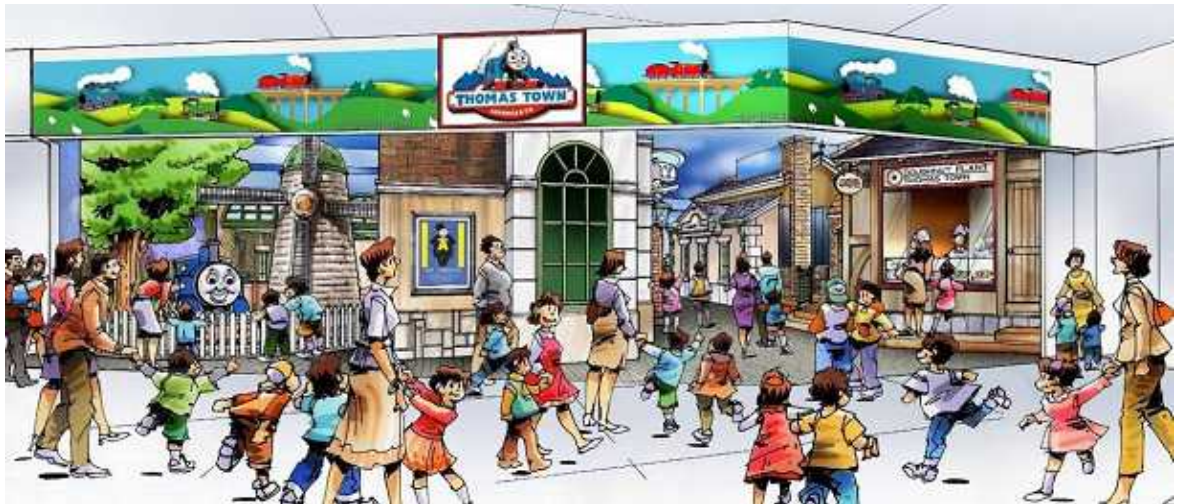
「トーマスタウン」(エントランス)