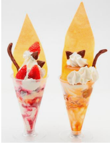
「猫かな？パフェ」「猫だよな！？パフェ」 サンタチューボー(アイスクリームシティ) 各 500 円 「猫かな？パフェ」(写真左)は北海道のパリパリクレープパフェにうもれたにゃんこを表現。「猫だよな！？パフェ」(写真右)はプリンパフェの中にうもれたにゃんこです。