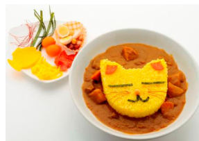
「あなたのねこカレー」 ナジャヴ倶楽部(ナンジャタウン内) 1,100 円

バターライスのにゃんこ顔に、うずら玉子・サラミ・プチニンジン・のり・錦糸玉子をのせて、自分だけのかわいいにゃんこを完成させてください！