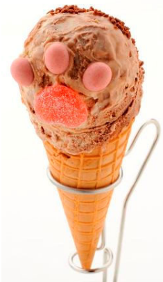
「まねきマジック」 マジックアイス(アイスクリームシティ) 450 円 バニラアイスにチョコアイスを-30度の鉄板の上でマジックミックスされたにゃんこの手。(にっきゅうはイチゴチョコとグミ)