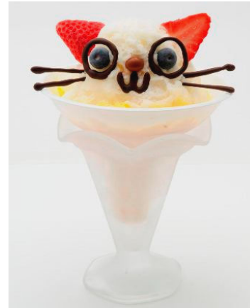
「ねこねこスノー」 マジックスノー(アイスクリームシティ) 500 円 台湾育ちの甘くてふわふわの毛をまとった、愛くるしい顔のふわふわアイスねこ。回りにはピーチソースがかけられています。