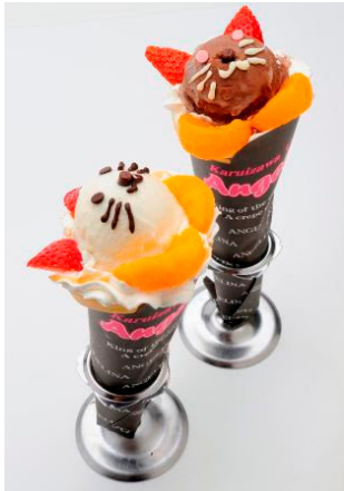
「ラッキーなミルクちゃん」「ハッピーなチョコちゃん」 アンジェリーナ(東京デザート共和国) 各 600 円 「ラッキーなミルクちゃん」(写真手前)は、バニラジェラートのにゃんこが顔を出したクレープです。「ハッピーなチョコちゃん」(写真奥)は、チョコジェラートのにゃんこが顔を出しています。