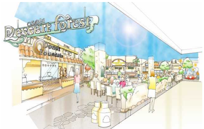
『大阪デザートフォレスト』イメージパース

ナムコは「遊びを通じて、お客様を幸せにします」を使命とし、これからもお客様に最も支持され、愛される施設運営を行うべく、日々邁進してまいります。