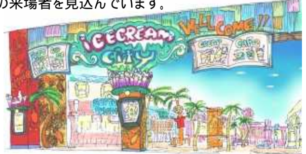
「アイスクリームシティ」イメージ

当施設は、南国のトロピカルなストリートを演出した『アイスクリームシティ』と“幸せのアイスクリームをつくるファンタジックな世界”を環境演出した『NAMCOLANDイオン各務原店』で構成された複合エンターテインメント施設です。今回、フードテーマパークに初めて大型アミューズメント施設「NAMCOLAND」を融合させることにより、子供から大人まで幅広い層のお客様に、美味しくお楽しみいただける施設を提供します。