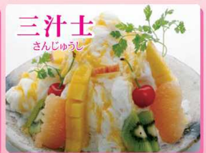
三汁士 さんじゅうし