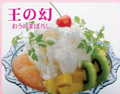
王の幻 おうのまほろし